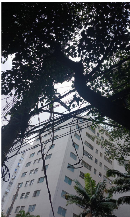
Figura 7. Registro do contato com a rede de distribuição