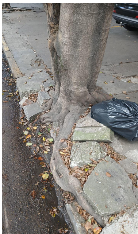
Figura 4. Registro da raiz