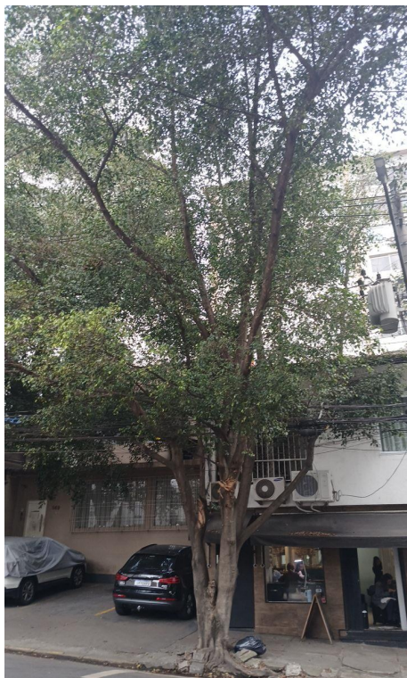
Figura 1. Registro da árvore