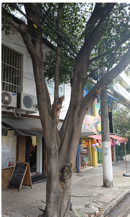
Figura 3. Registro do tronco