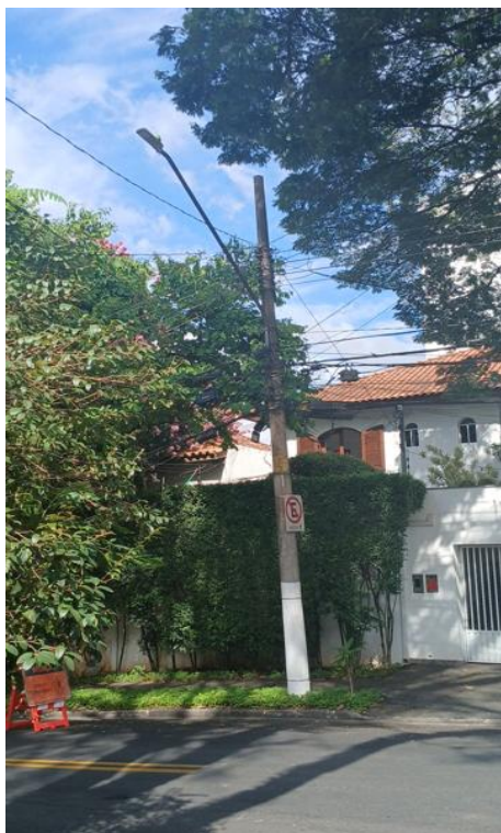
Figura 7. Registro do contato com a rede de distribuição