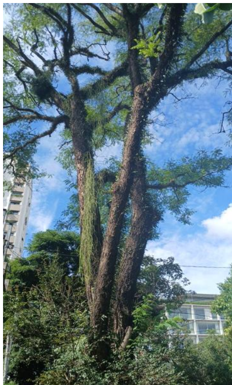
Figura 1. Registro da árvore