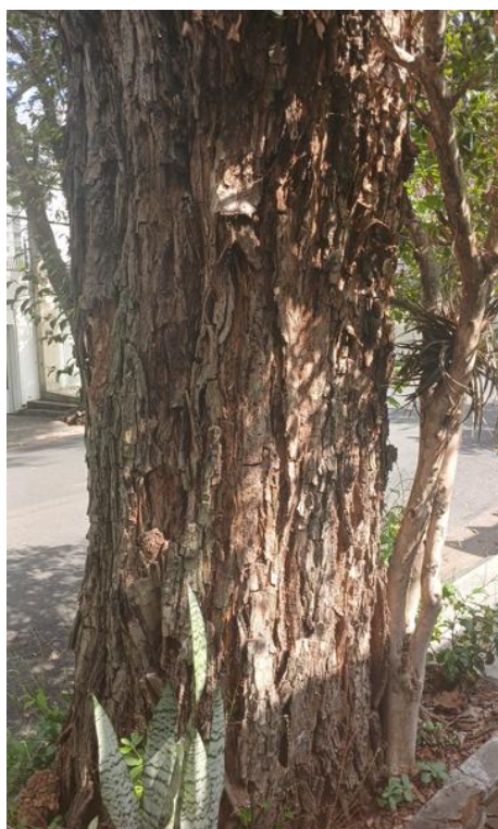
Figura 3. Registro do tronco