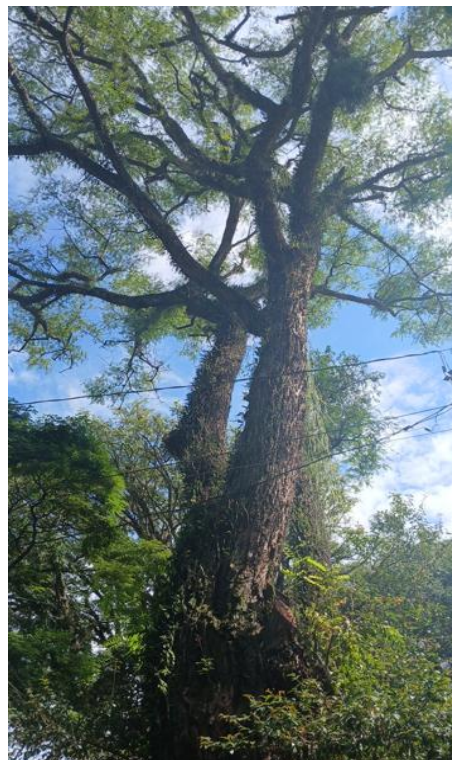
Figura 5 e 6. Registro dos fatores de risco de queda