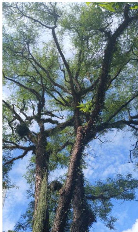
Figura 2. Registro da copa