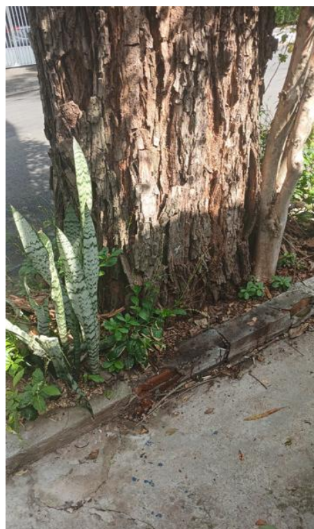
Figura 4. Registro da raiz