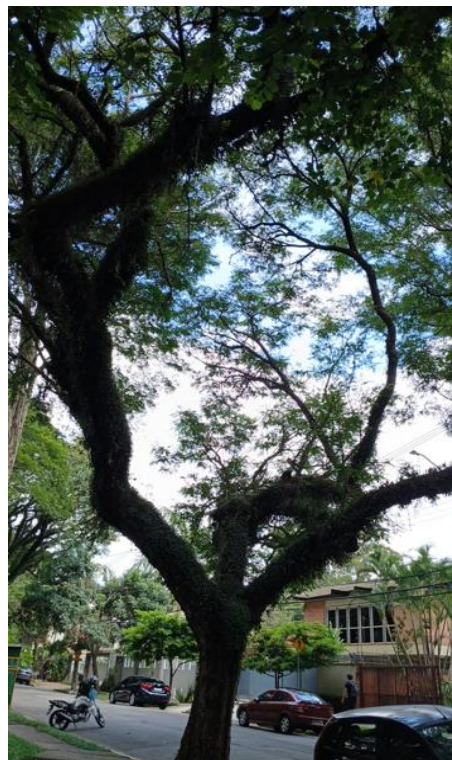
Figura 2. Registro da copa