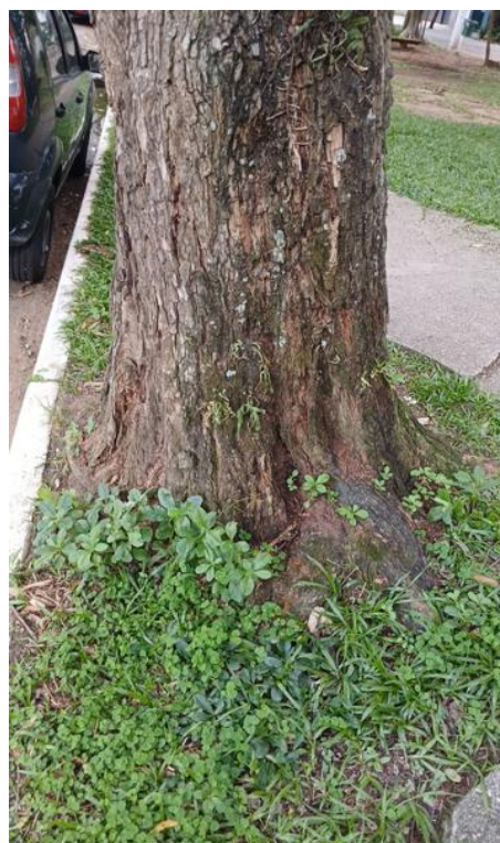
Figura 4. Registro da raiz