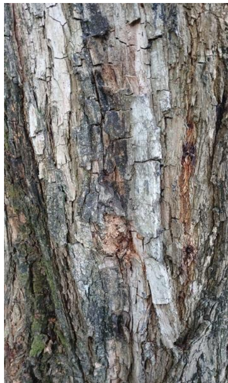
Figura 5 e 6. Registro dos fatores de risco de queda