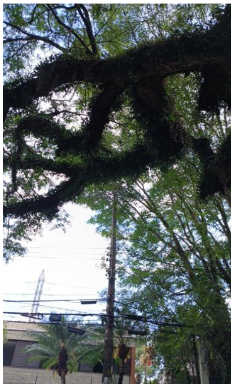
Figura 7. Registro do contato com a rede de distribuição