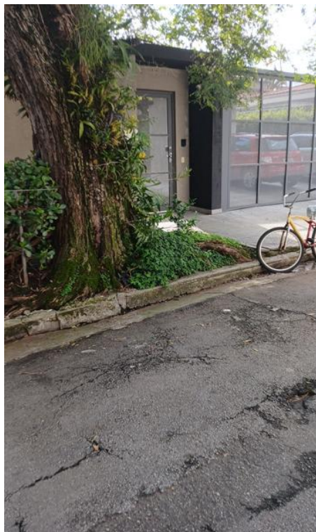
Figura 5 e 6. Registro dos fatores de risco de queda