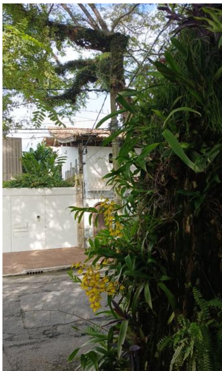
Figura 7. Registro do contato com a rede de distribuição