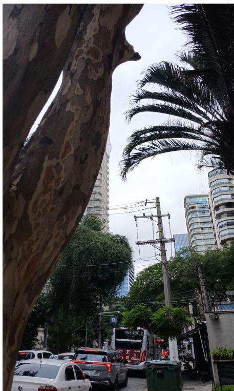
Figura 7. Registro do contato com a rede de distribuição