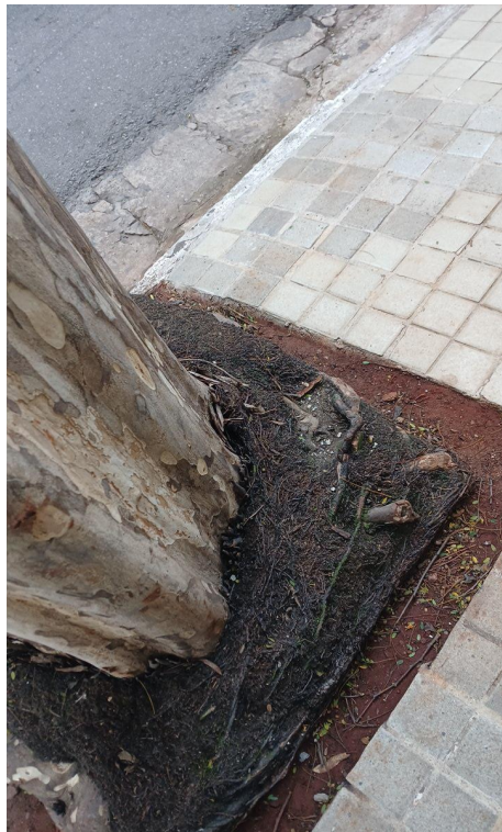
Figura 5 e 6. Registro dos fatores de risco de queda