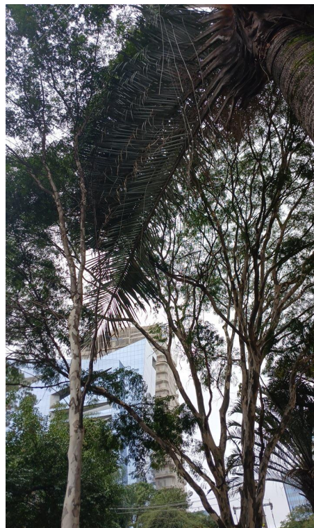
Figura 2. Registro da copa