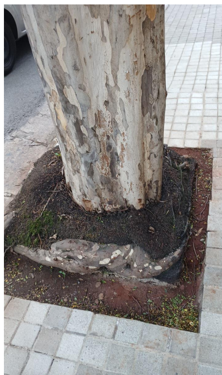
Figura 4. Registro da raiz