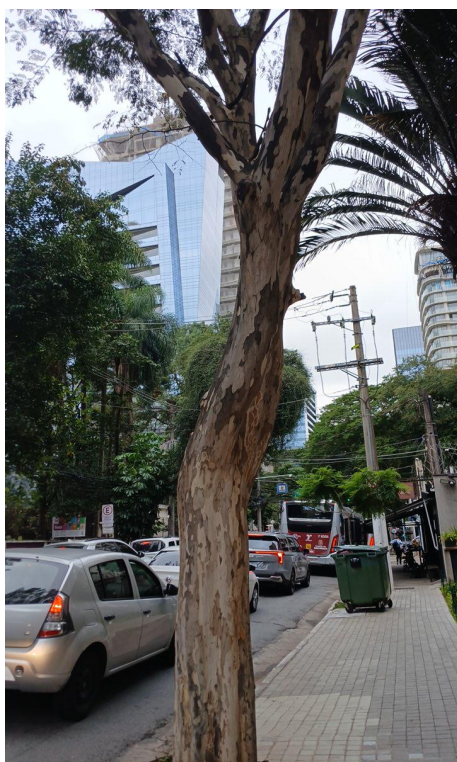
Figura 3. Registro do tronco