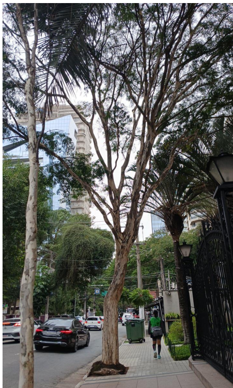
Figura 1. Registro da árvore