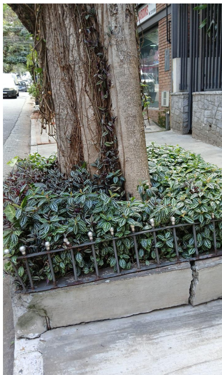
Figura 4. Registro da raiz