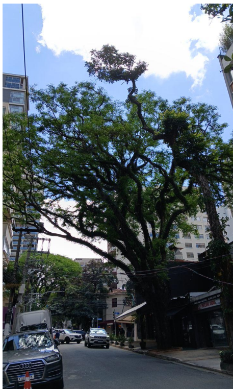
Figura 7. Registro do contato com a rede de distribuição