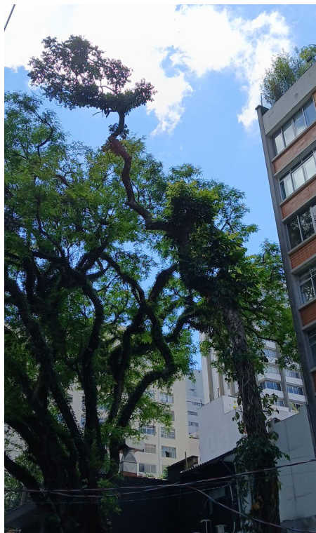
Figura 2. Registro da copa