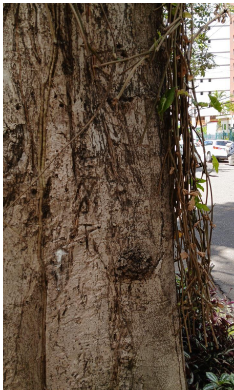
Figura 5 e 6. Registro dos fatores de risco de queda