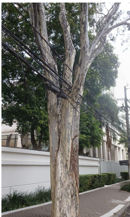
Figura 3. Registro do tronco