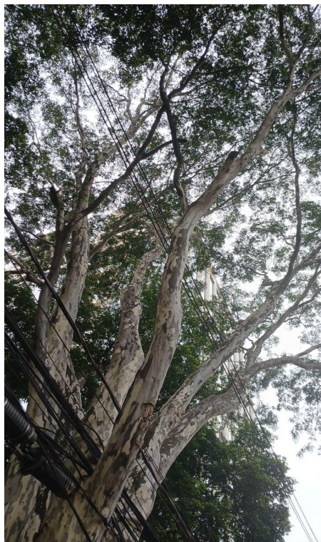
Figura 2. Registro da copa