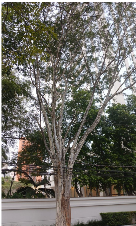
Figura 1. Registro da árvore