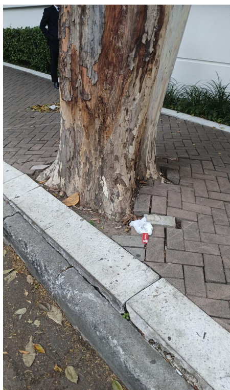
Figura 4. Registro da raiz