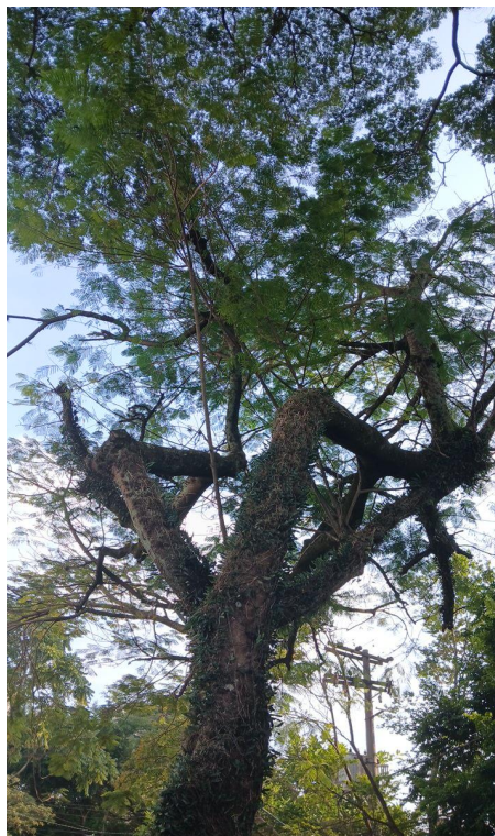
Figura 2. Registro da copa