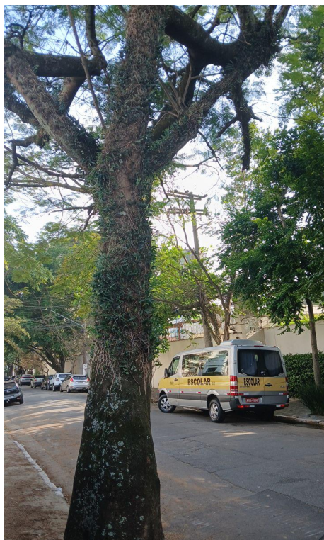
Figura 7. Registro do contato com a rede de distribuição