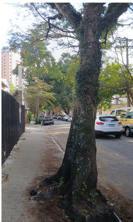
Figura 3. Registro do tronco