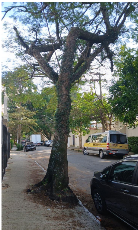
Figura 1. Registro da árvore