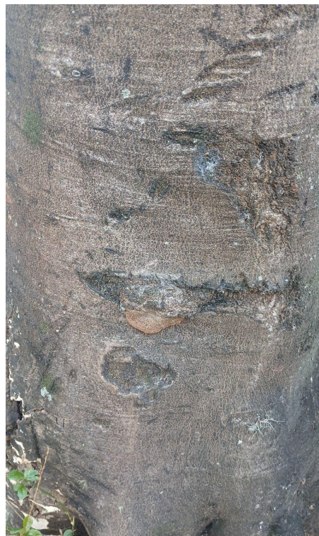
Figura 5 e 6. Registro dos fatores de risco de queda