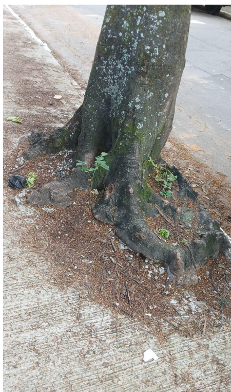
Figura 4. Registro da raiz