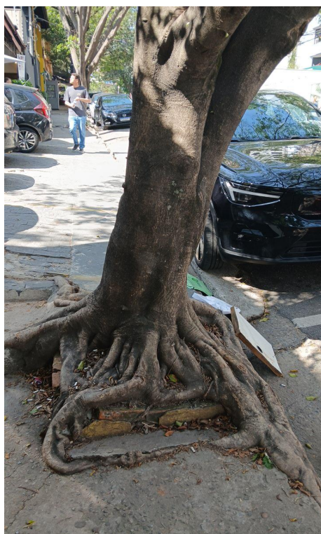
Figura 3. Registro do tronco