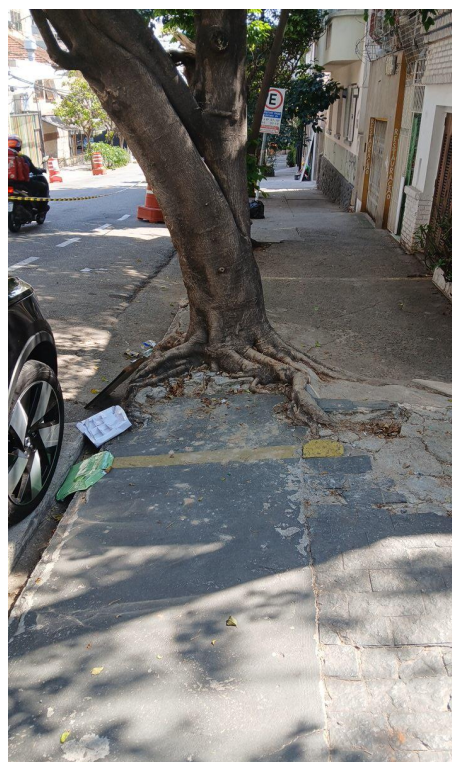
Figura 4. Registro da raiz