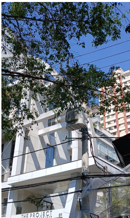
Figura 7. Registro do contato com a rede de distribuição