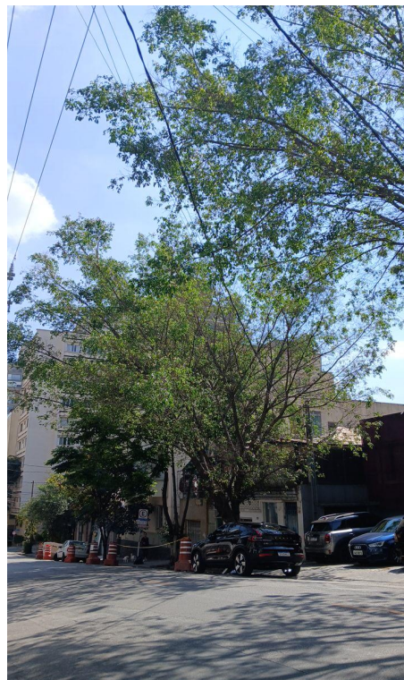
Figura 2. Registro da copa