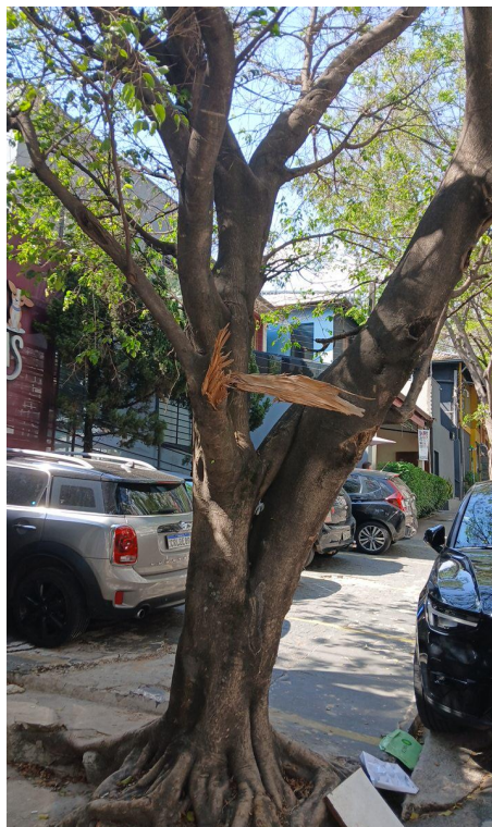
Figura 5 e 6. Registro dos fatores de risco de queda