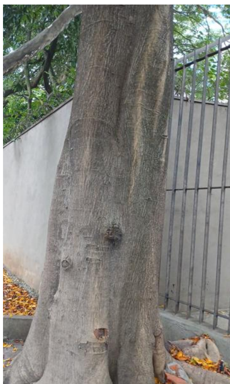
Figura 3. Registro do tronco