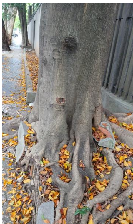
Figura 4. Registro da raiz