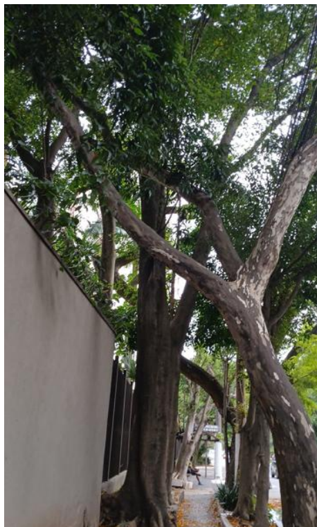
Figura 1. Registro da árvore