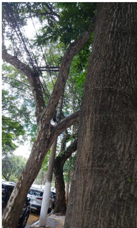
Figura 7. Registro do contato com a rede de distribuição