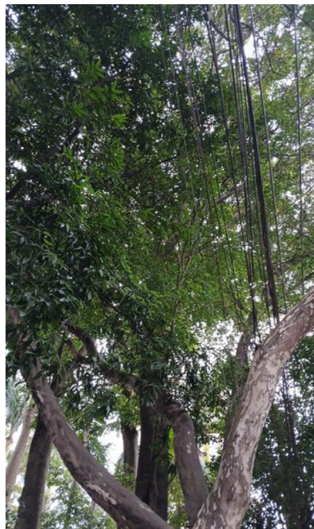
Figura 2. Registro da copa