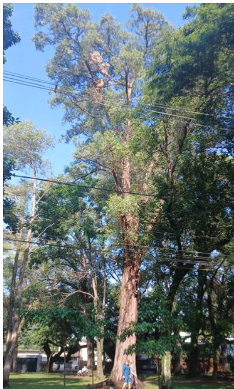
Figura 1. Registro da árvore