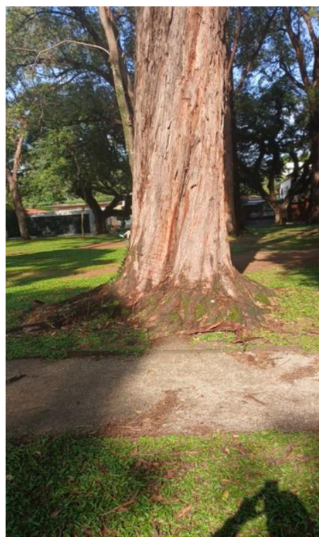
Figura 4. Registro da raiz