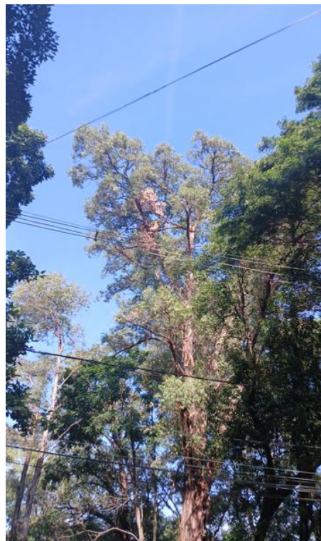
Figura 2. Registro da copa