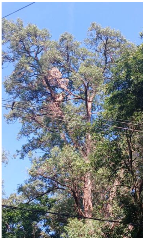
Figura 7. Registro do contato com a rede de distribuição