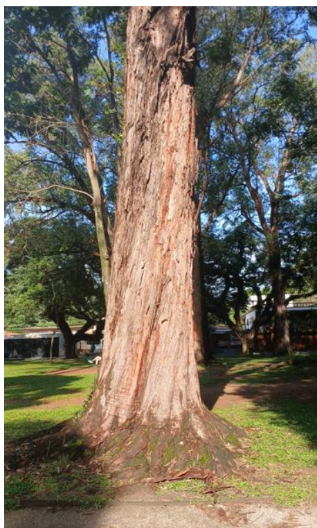
Figura 3. Registro do tronco