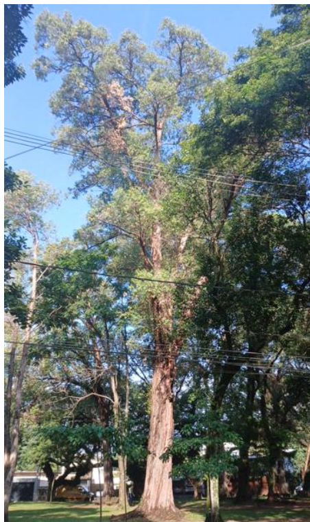
Figura 5 e 6. Registro dos fatores de risco de queda