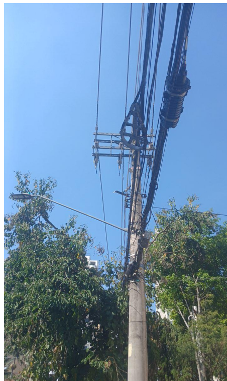
Figura 2. Registro da copa