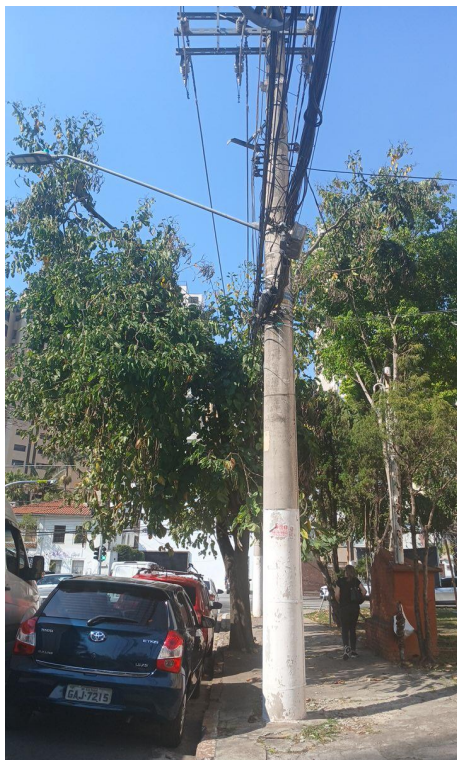
Figura 1. Registro da árvore