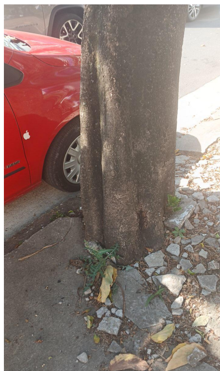
Figura 4. Registro da raiz