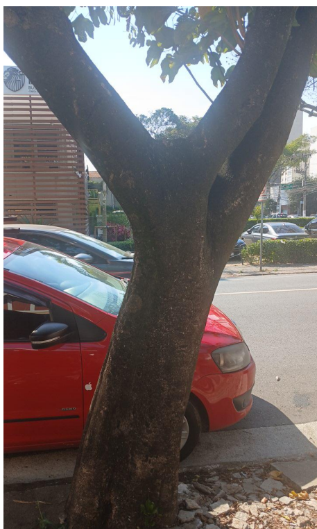
Figura 3. Registro do tronco