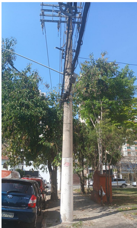
Figura 7. Registro do contato com a rede de distribuição