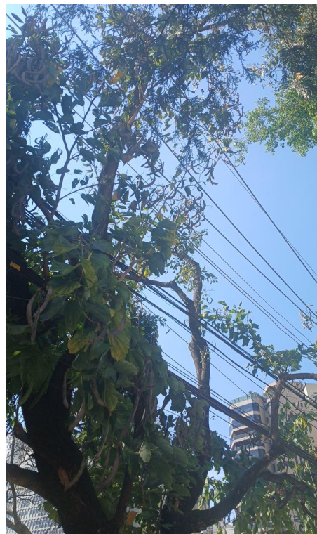
Figura 5 e 6. Registro dos fatores de risco de queda