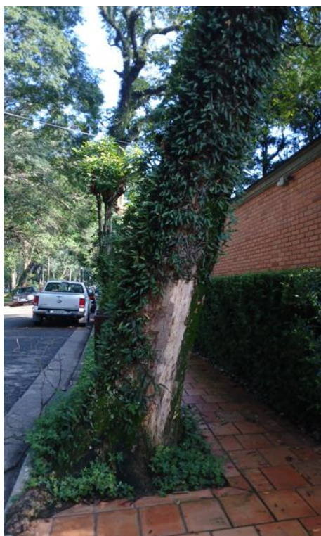
Figura 3. Registro do tronco