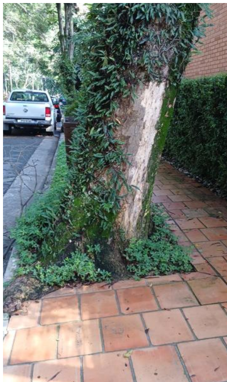
Figura 5 e 6. Registro dos fatores de risco de queda