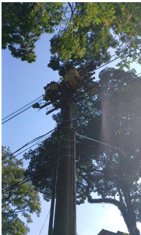
Figura 7. Registro do contato com a rede de distribuição