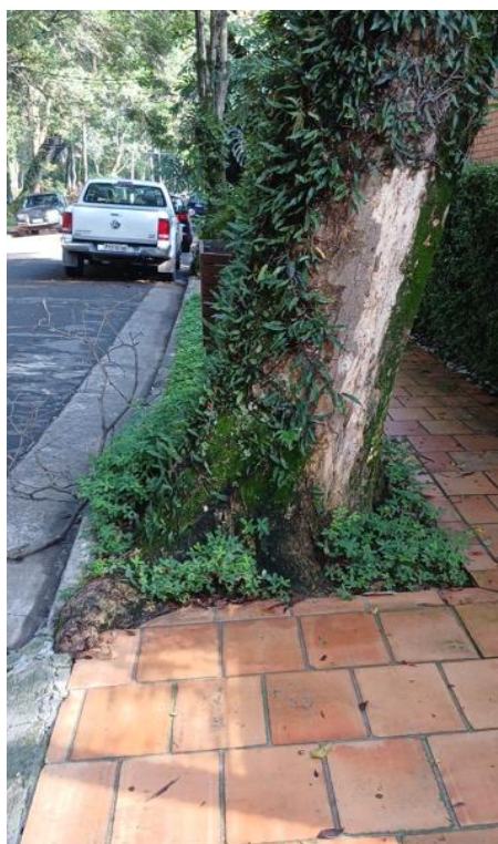
Figura 4. Registro da raiz