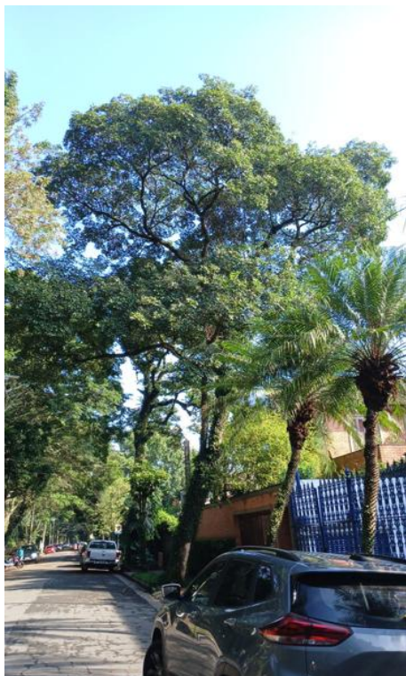
Figura 1. Registro da árvore