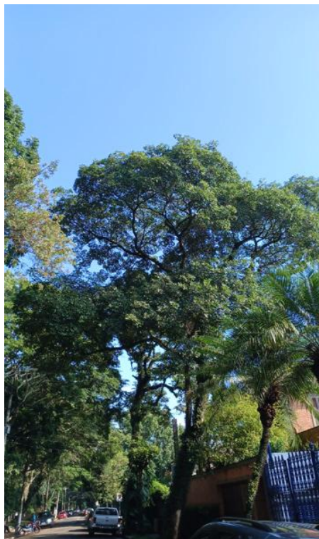
Figura 2. Registro da copa