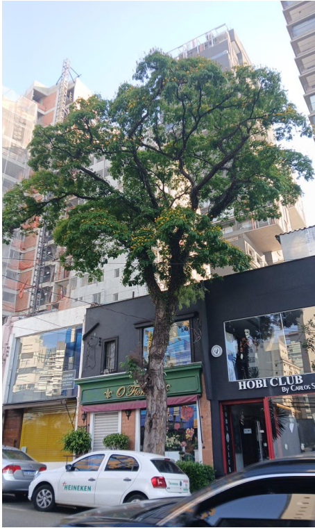
Figura 1. Registro da árvore