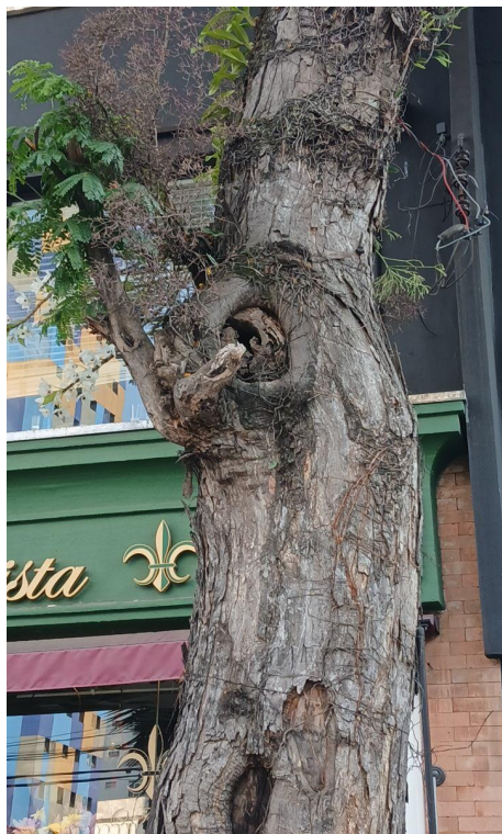
Figura 5 e 6. Registro dos fatores de risco de queda