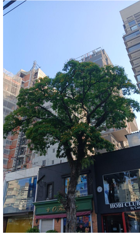
Figura 2. Registro da copa