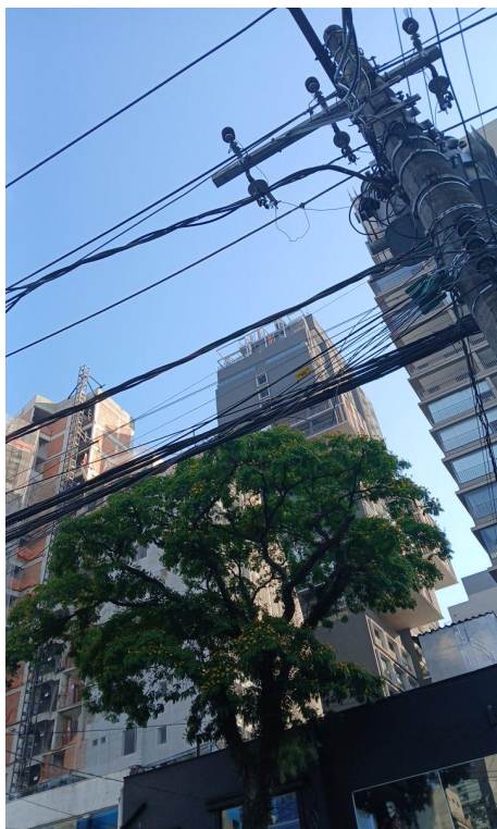
Figura 7. Registro do contato com a rede de distribuição