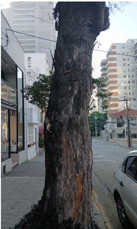
Figura 3. Registro do tronco