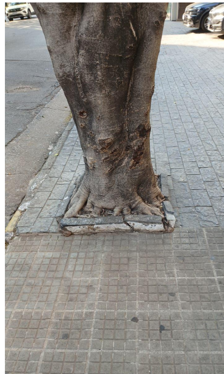
Figura 4. Registro da raiz