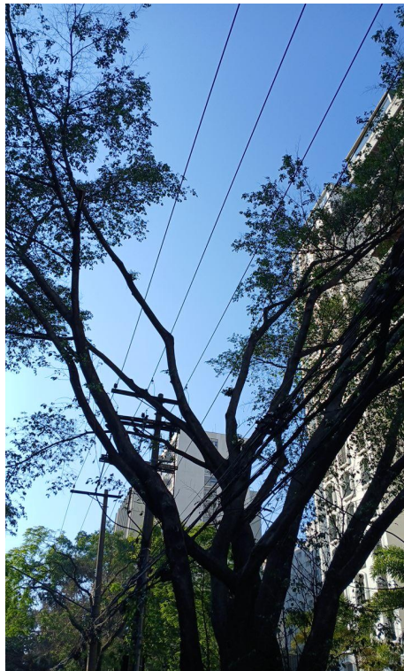
Figura 5 e 6. Registro dos fatores de risco de queda