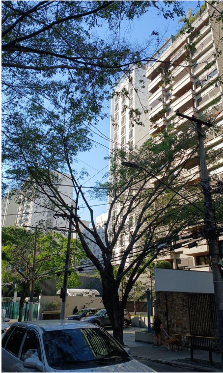
Figura 1. Registro da árvore