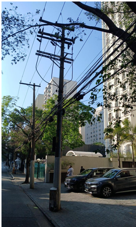
Figura 7. Registro do contato com a rede de distribuição