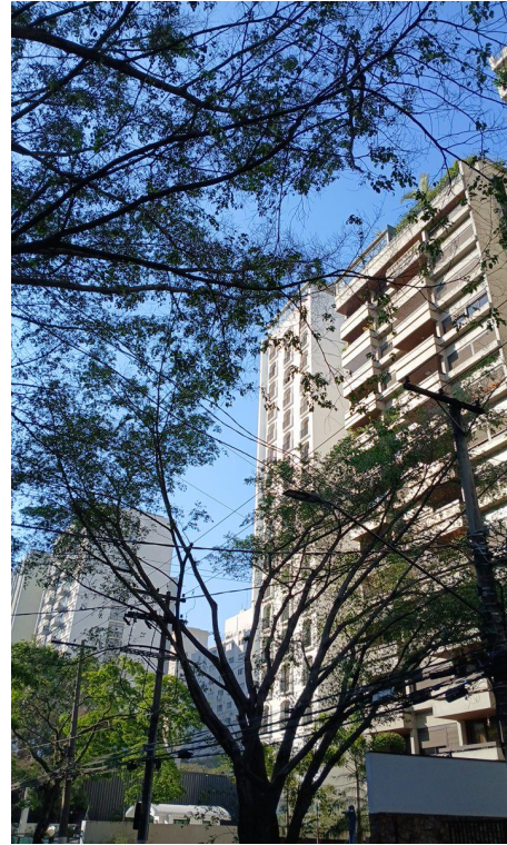
Figura 2. Registro da copa