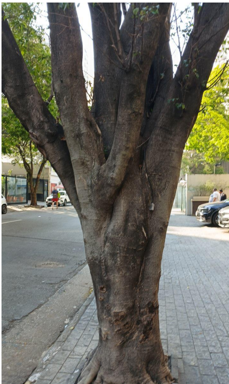
Figura 3. Registro do tronco