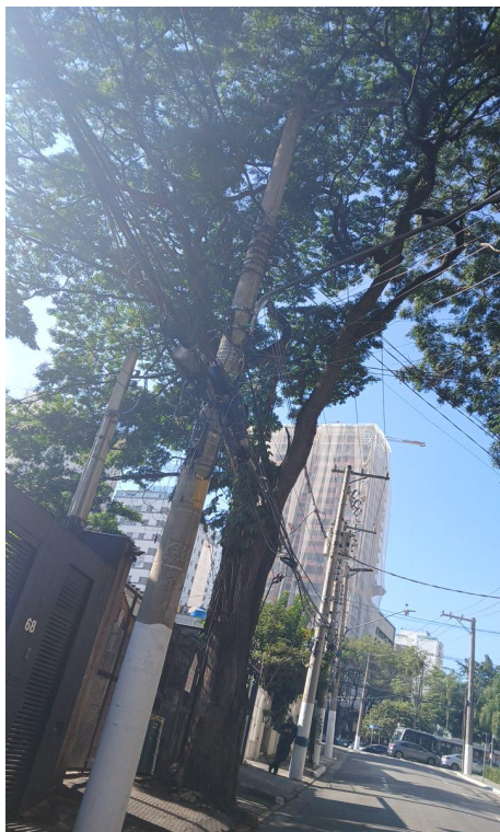
Figura 1. Registro da árvore