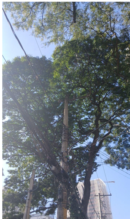
Figura 2. Registro da copa