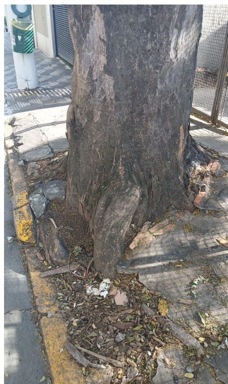
Figura 4. Registro da raiz