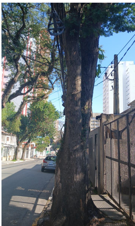
Figura 3. Registro do tronco