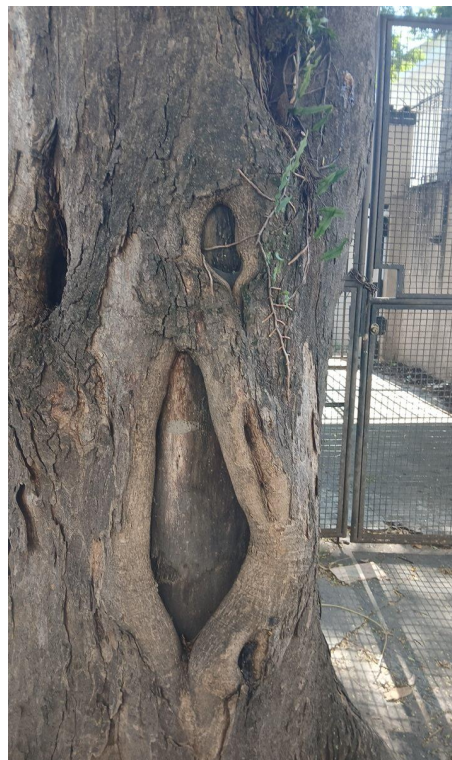
Figura 5 e 6. Registro dos fatores de risco de queda