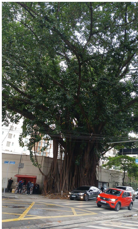
Figura 1. Registro da árvore