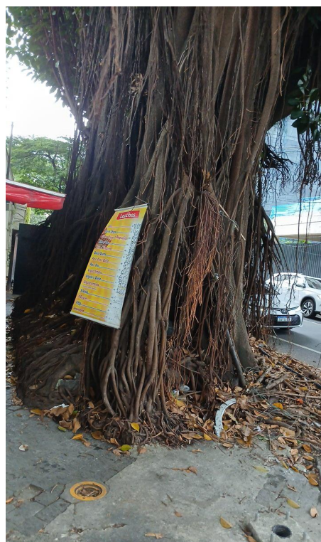
Figura 4. Registro da raiz