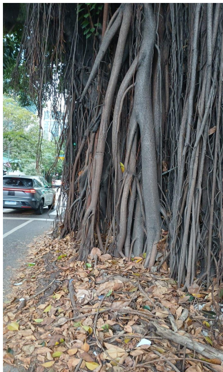
Figura 5 e 6. Registro dos fatores de risco de queda