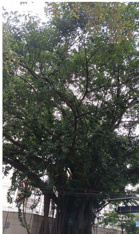
Figura 2. Registro da copa