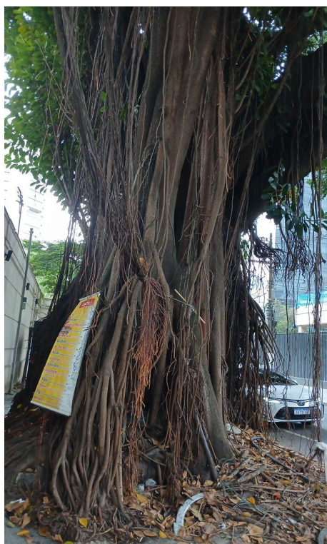
Figura 3. Registro do tronco