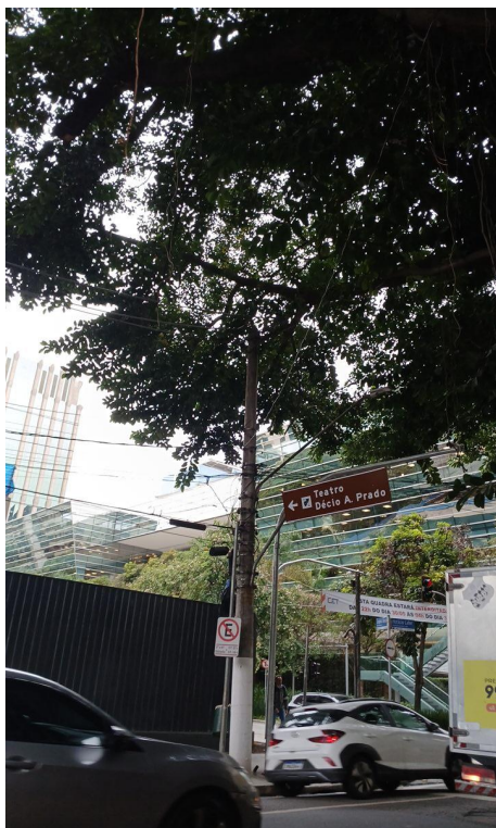
Figura 7. Registro do contato com a rede de distribuição