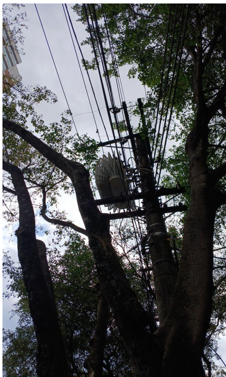
Figura 7. Registro do contato com a rede de distribuição