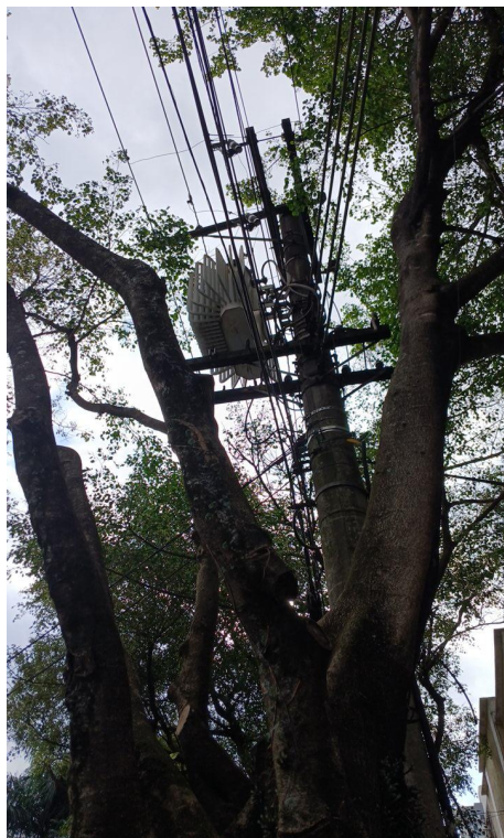
Figura 5 e 6. Registro dos fatores de risco de queda