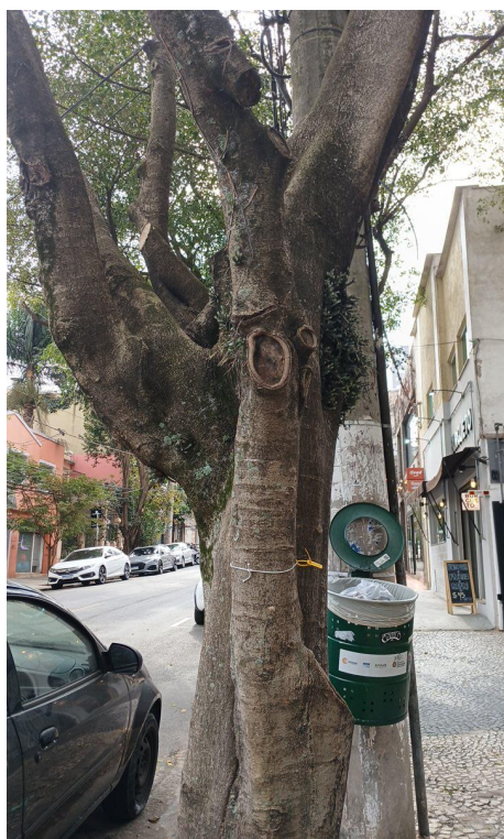
Figura 3. Registro do tronco