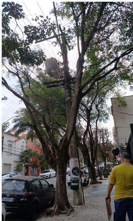
Figura 1. Registro da árvore