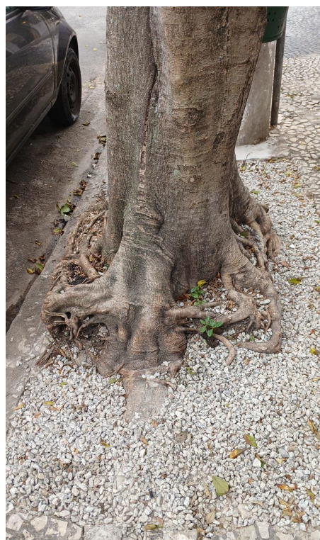
Figura 4. Registro da raiz