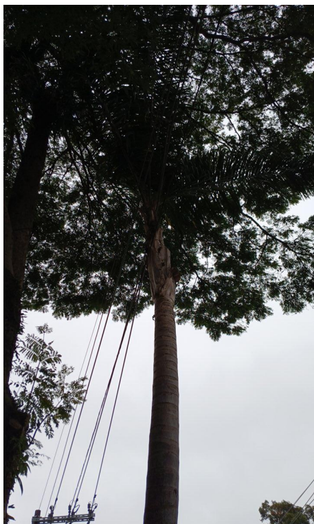
Figura 7. Registro do contato com a rede de distribuição