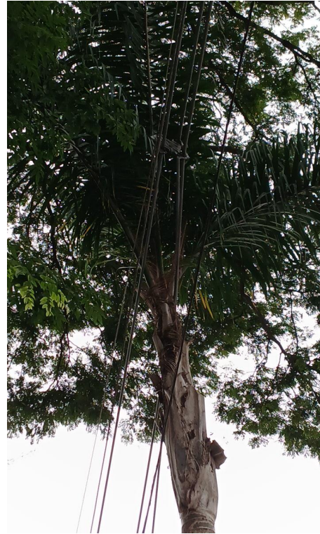
Figura 2. Registro da copa