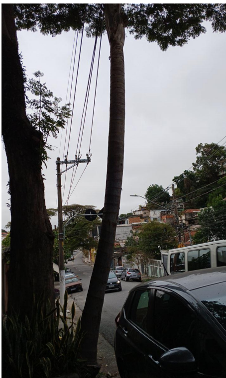
Figura 3. Registro do tronco