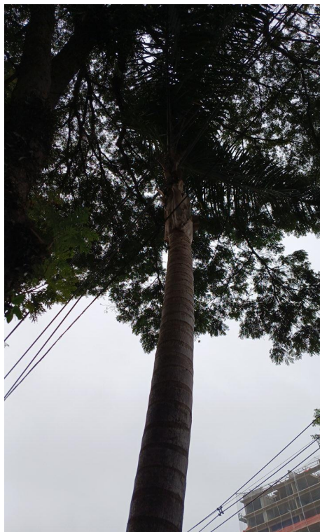
Figura 5 e 6. Registro dos fatores de risco de queda