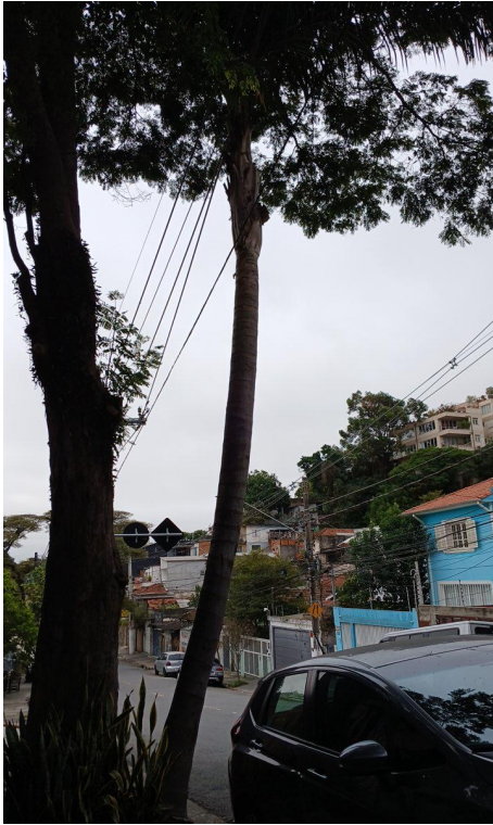
Figura 1. Registro da árvore