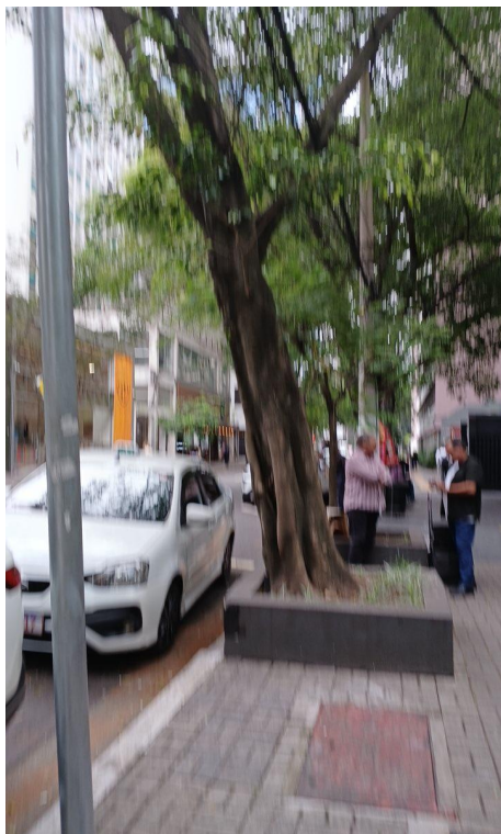
Figura 1. Registro da árvore