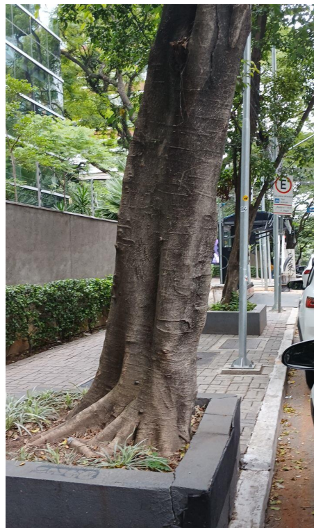
Figura 5 e 6. Registro dos fatores de risco de queda