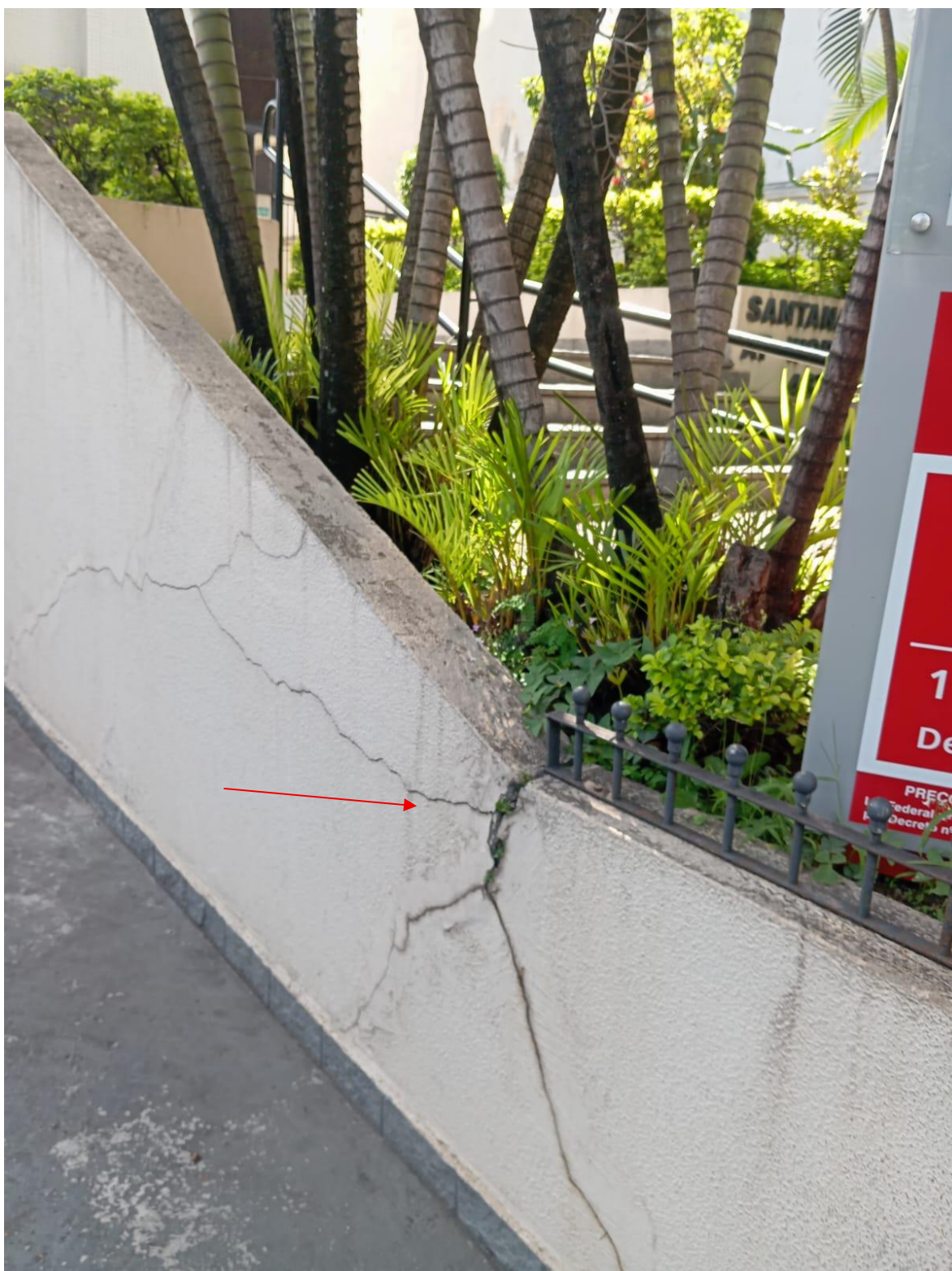
Foto 3. Esta imagem demonstra o fato do seu sistema radicular incompatível com o canteiro, ela se alastra no pequeno espaço, enovela seu sistema radicular até secar por inteiro e morrer.