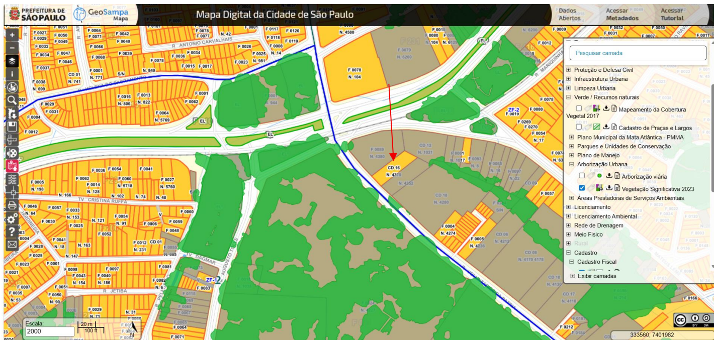
Imagem 1. Mapa de Vegetação Significativa de São Paulo, 2023 sobreposto ao Mapa de Cadastro Fiscal; o condomínio comercial encontra-se fora de Vegetação Significativa. A seta vermelha indica o acesso ao lote particular na Rua Voluntários da Pátria, 4370, Santana – São Paulo/SP.

Endereço: Rua Voluntários da Pátria, 4370, Santana – São Paulo/SP. CEP: 02.402-600.