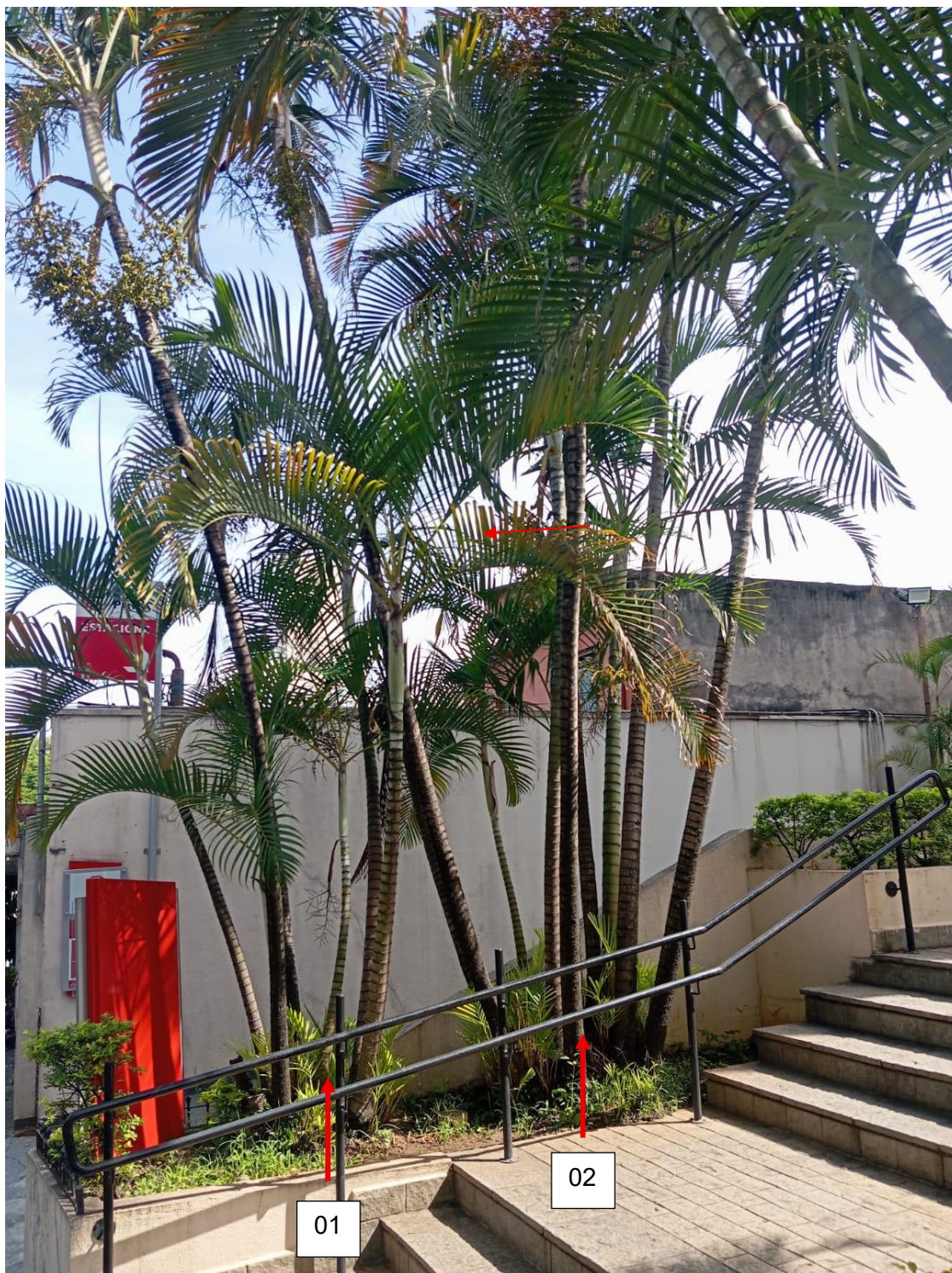
Foto 01. As arecas tem sistema radicular agressivo, essa espécie exótica deve ser substituída por variedade nativa, no mesmo canteiro, após destoca.