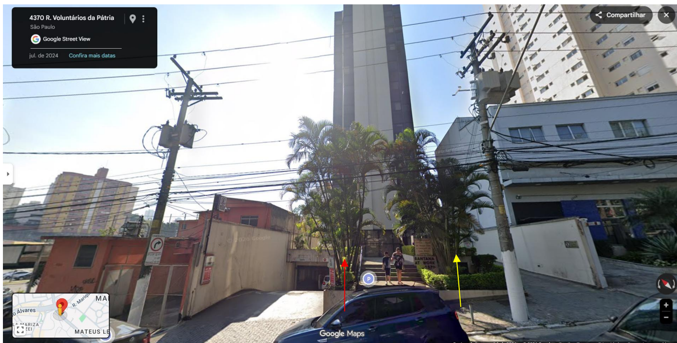
Imagem 2. Imagem com a vista do lote particular do condomínio comercial. A seta vermelha, indica os dois espécimes que precisam de manejo e a seta amarela indica o espécime a ser preservado, em lote comercial particular na Rua Voluntários da Pátria, 4370, Santana – São Paulo/SP.