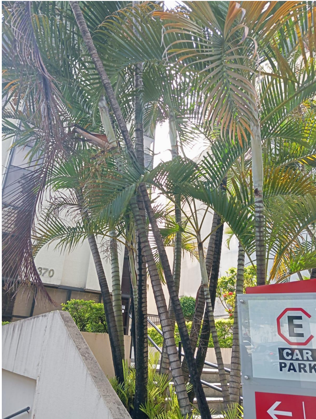
Foto 2. As palmeiras exóticas não trazem benefício a avifauna local, sendo um ganho o plantio substitutivo por espécimes endêmicas.