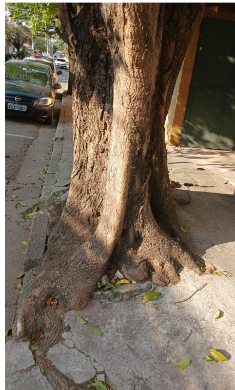
Figura 4. Registro da raiz