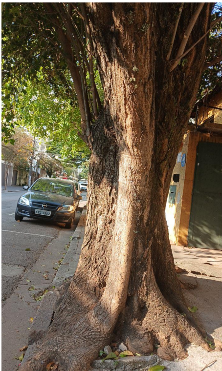
Figura 3. Registro do tronco