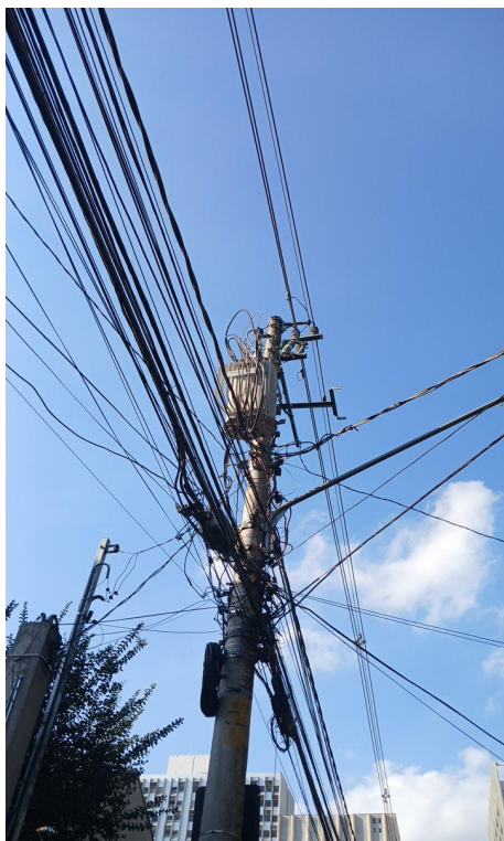
Figura 7. Registro do contato com a rede de distribuição