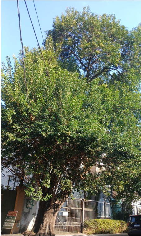
Figura 1. Registro da árvore