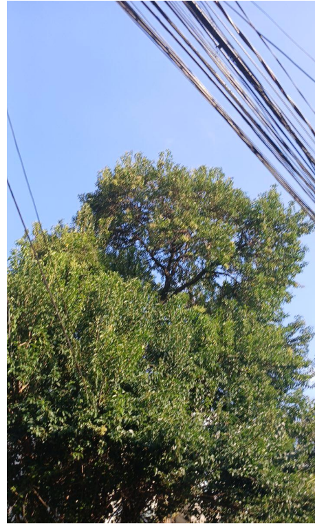
Figura 2. Registro da copa