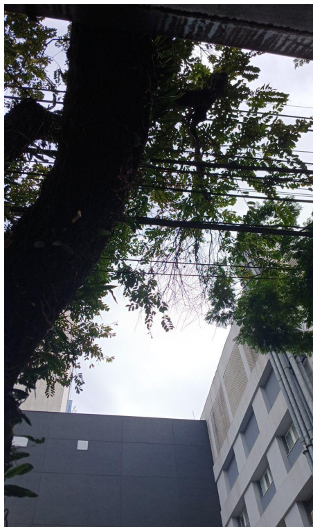
Figura 5 e 6. Registro dos fatores de risco de queda