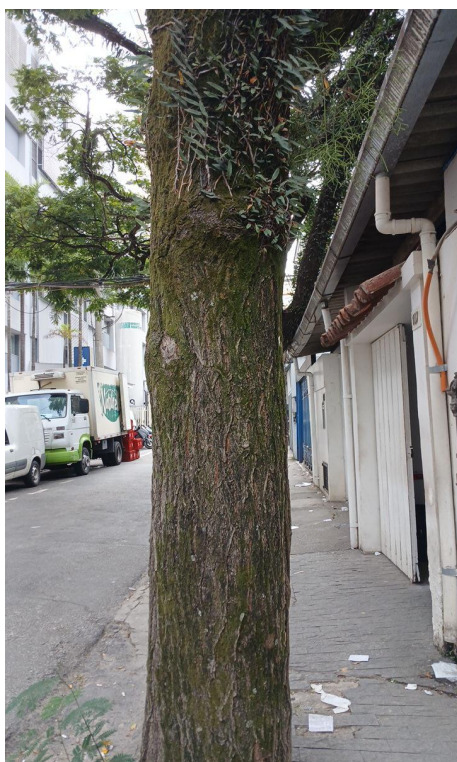
Figura 3. Registro do tronco