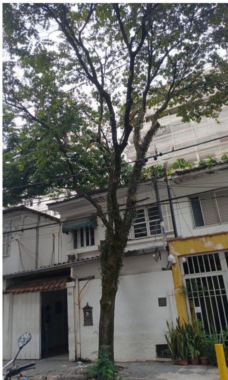
Figura 1. Registro da árvore