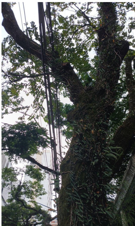
Figura 7. Registro do contato com a rede de distribuição