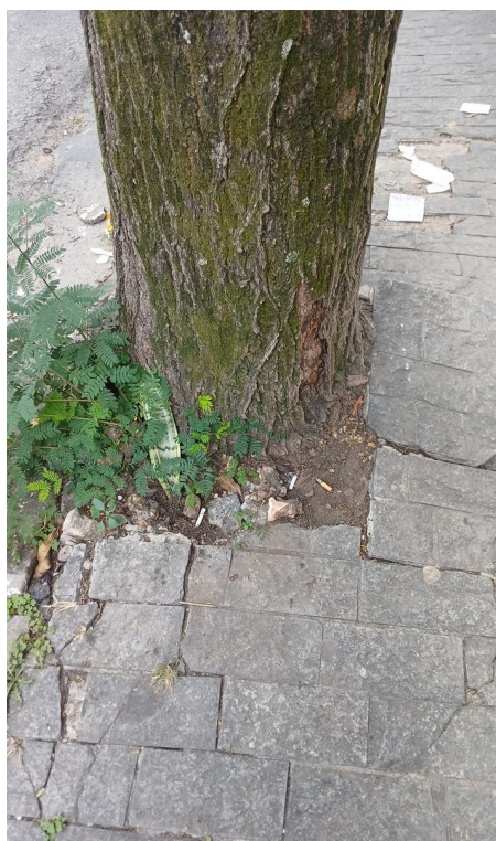
Figura 4. Registro da raiz