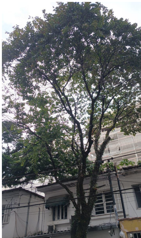
Figura 2. Registro da copa