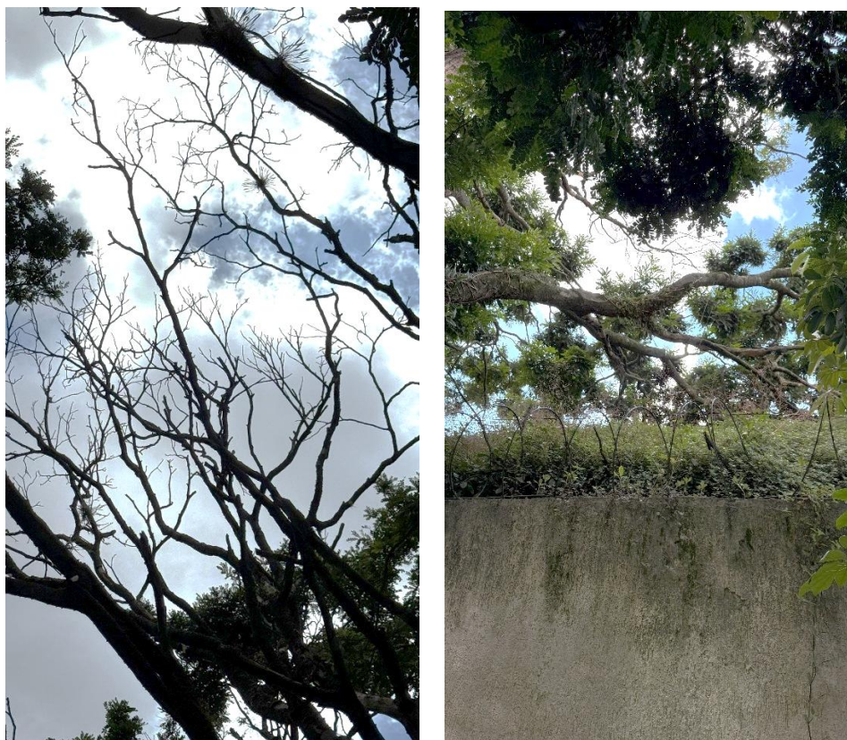
Figuras 3 e 4 – Detalhes de ramos secos e projeções para vizinho.