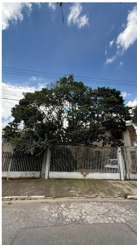
Figuras 5 – Vista geral da árvore indicada para poda (pau-brasil).