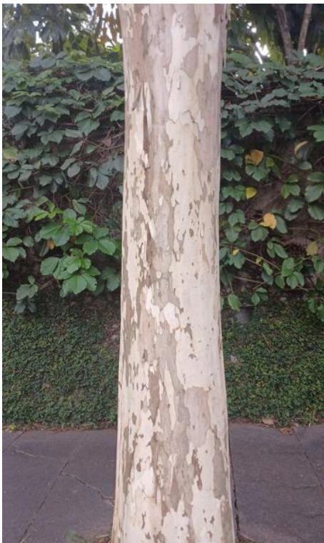
Figura 3. Registro do tronco