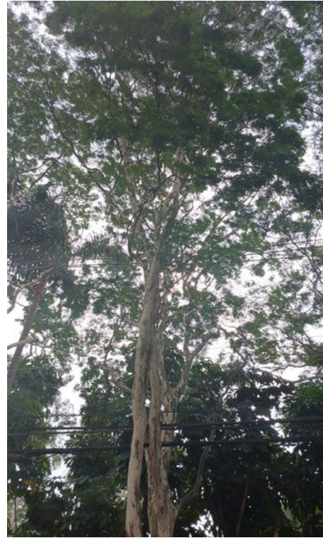
Figura 2. Registro da copa