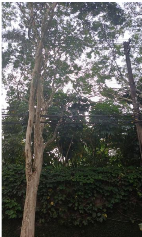
Figura 7. Registro do contato com a rede de distribuição