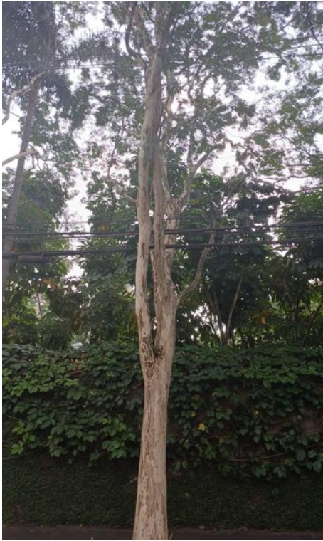
Figura 1. Registro da árvore