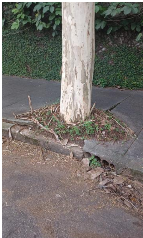
Figura 5 e 6. Registro dos fatores de risco de queda