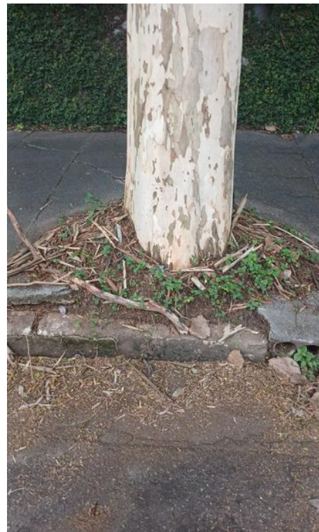
Figura 4. Registro da raiz