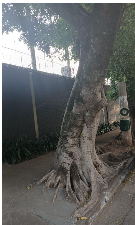
Figura 3. Registro do tronco