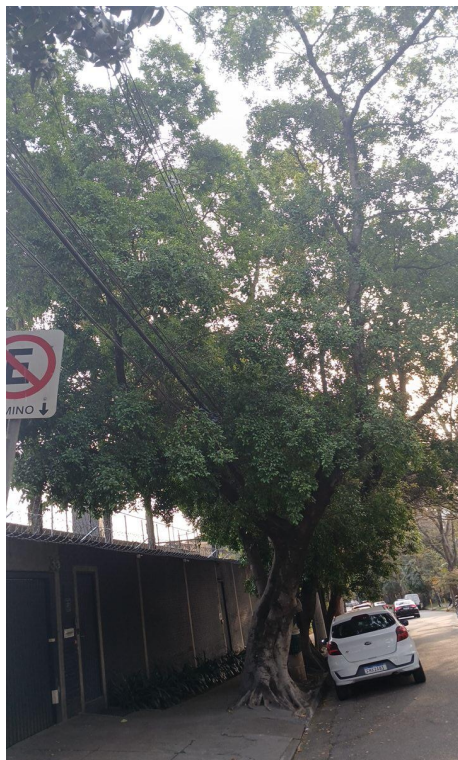
Figura 1. Registro da árvore