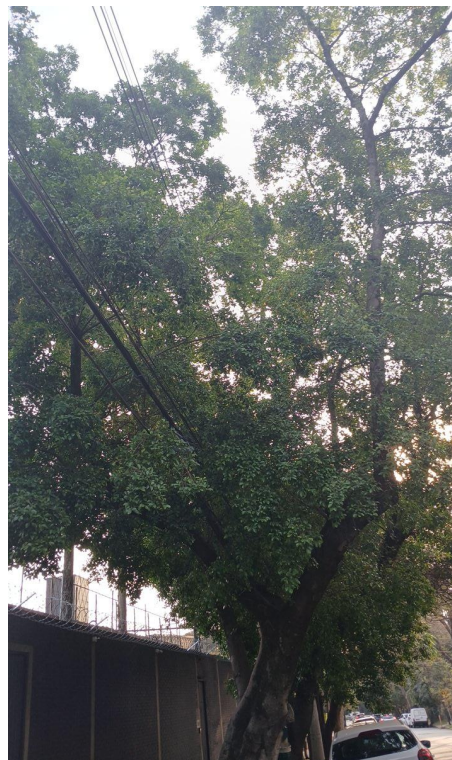
Figura 2. Registro da copa