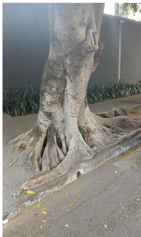
Figura 4. Registro da raiz