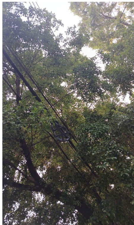
Figura 5 e 6. Registro dos fatores de risco de queda